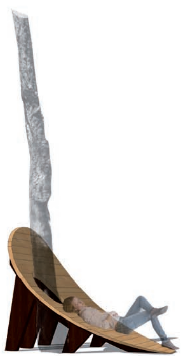
Vista de perfil